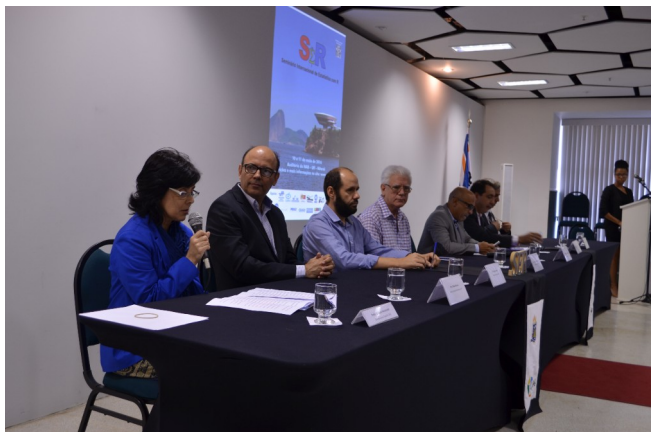
Mesa de abertura do evento SER.