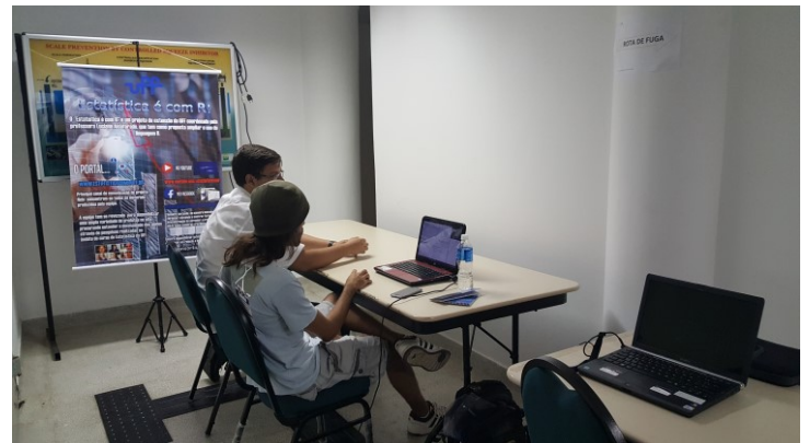
Laboratório de Experimentação.

Tivemos a presença de três apresentações no espaço blog, mostrando a importância dos mesmos para a disseminação do conhecimento entre a nova geração de pesquisadores no Brasil.