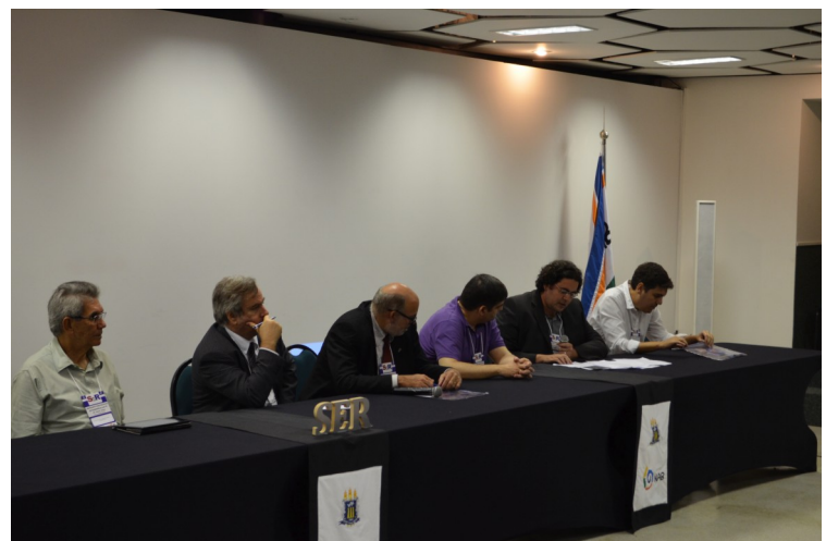
Mesa de debate: "Das pesquisas acadêmicas às grandes empresas".