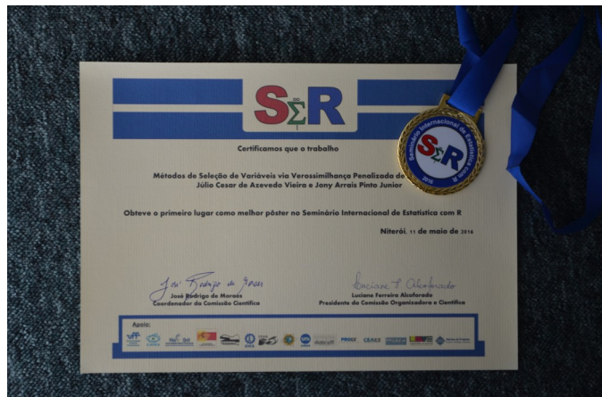
Medalha e certificado para os três primeiros colocados.

O SER contou ainda com parcerias externas à UFF, da Escola Nacional de Ciências Estatísticas (ENCE), do Instituto de Matemática Pura e Aplicada (IMPA) e o apoio da CAPES através do seu Programa de Apoio a Eventos no País.