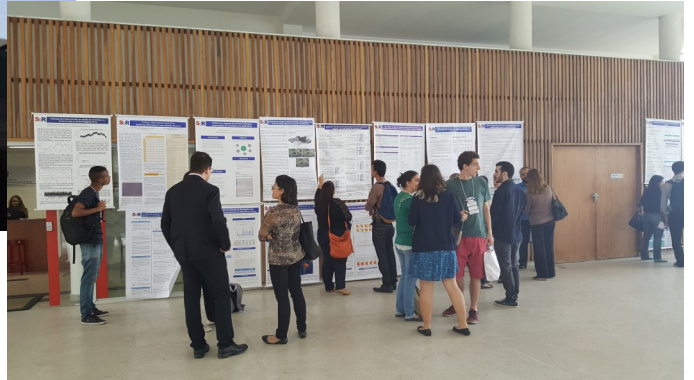
Sessão pôster no SER.

A sessão pôster permitiu a troca de conhecimentos entre alunos, professores e pesquisadores, e as oficinas em Laboratório de Informática no Campus do Gragoatá, em ambos os dias do evento, promoveram o aprendizado de diversas ferramentas disponíveis no ambiente R.