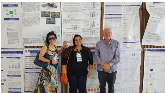
Sessão pôster no SER.