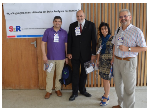
Professores da Universidade de Santiago de Compostela prestigiam o primeiro SER.